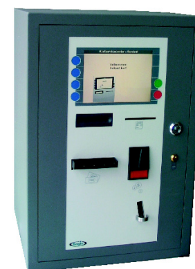
Sagio kortet kan genoplades direkte fra bankkonto, lønkonto eller med kontanter.