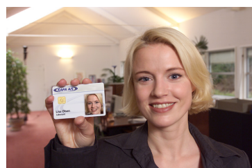
Visuel og elektronisk identifikation

Ingen gebyrer · Kort transaktionstid · Ingen vekselpoblemer Minimal ventetid · Ingen kasseoptælling · Ingen mønt- problemer i automater · Mindre risiko for tyveri og hærværk Mere hygiejnisk