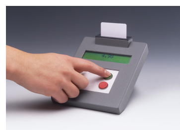
Kunden betaler selv med sit kort. Hurtigt, enkelt og hygiejnisk.